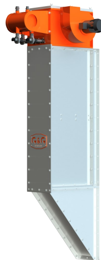
vertikalna izvedba filtra